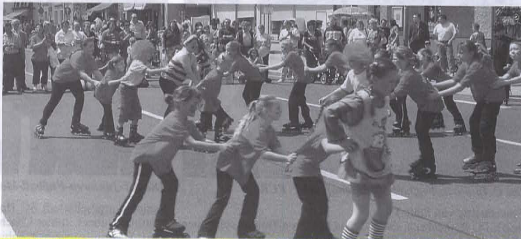
Wieder mit dabei die Inline-Skater aus Nürnberg - Mögeldorf mit ihrer neuesten Präsentation zum Thema „Amerika“.

Nun bereits zum siebten Mal haben Besucher aus Nah und Fern die Gelegenheit, sich beim "Röthenbacher Gewerbetag", der heuer am 6. Mai stattfindet, von der Leistungsstärke und der Angebotsvielfalt des örtlichen Handels und Handwerks zu überzeugen. Mit zahlreichen Aktionen wollen die teilnehmenden Geschäfte - bei Redaktionsschluss waren es diesmal ca. 50 (!) - den Besuchern einen unterhaltsamen verkaufsoffenen Sonntag entlang der Rückersdorfer Str. bis zum Friedrichplatz und am Gewerbepark, gestalten.